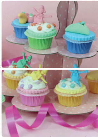
משלוח מנות של עוגאיה